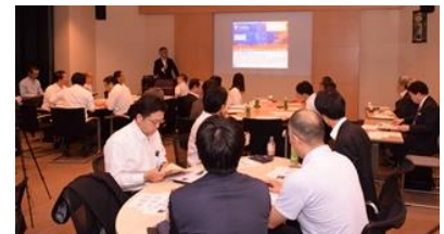
第 1 回（第 1 章）5 月 16 日

中央経済社 定価 3,456 円（税込）リード・ヘイズ（著）、近江 元（翻訳）、阿部孔孝（翻訳）